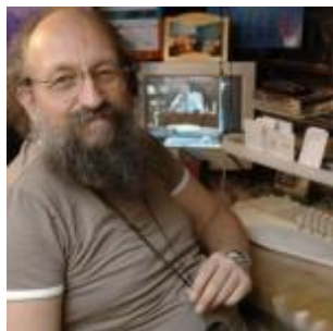
советский, украинский и

Повышение по ступеням потребностей (от низших к высшим) говорит о совершенствовании человека, понижение – о его деградации. (Олигарх и диссер )